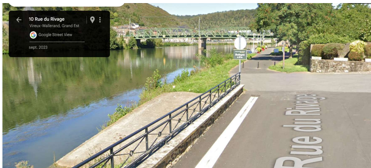
Rue du rivage