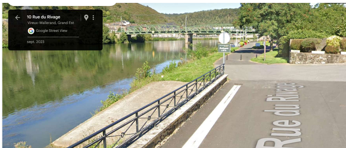
Rue du rivage