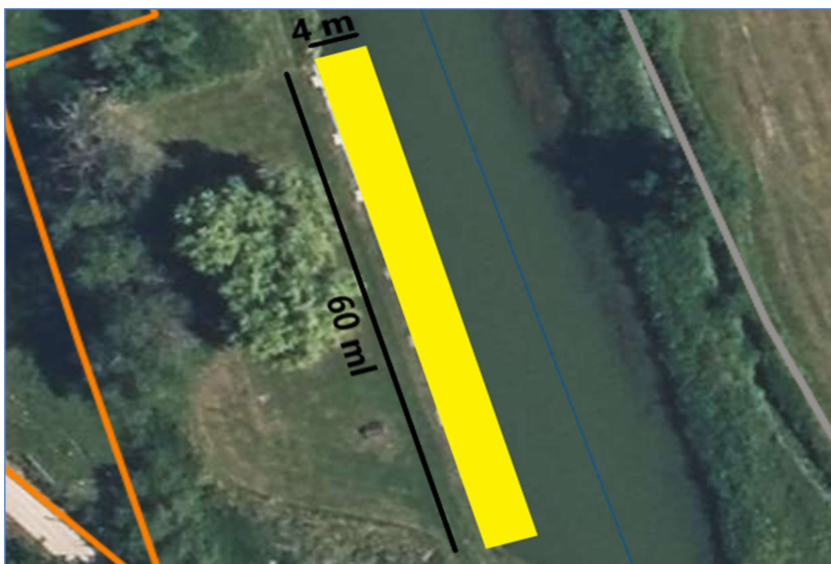
Dimension de l'appel à projet