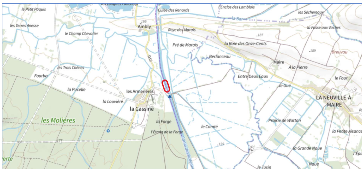
Emplacement de l'appel à projet