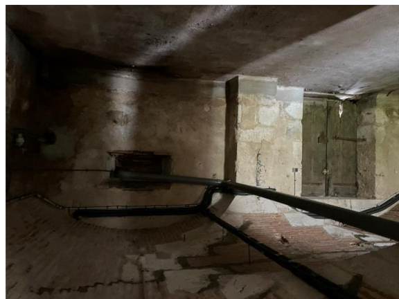
ME 31 de Noubelins - Extérieur :