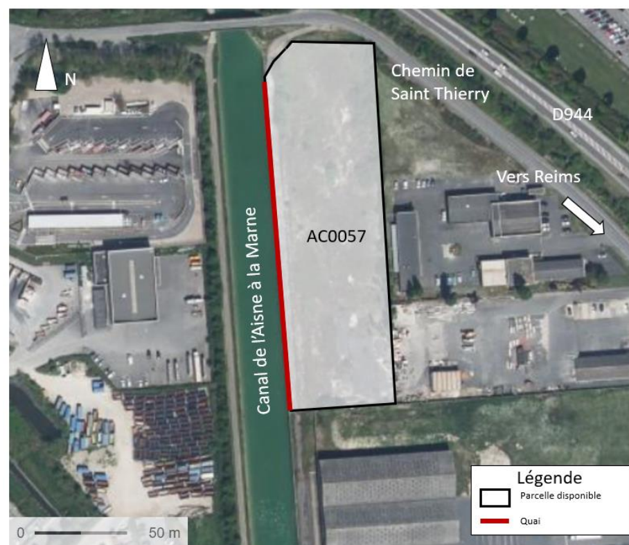
Parcelle n°1 – Zone des Coïdes