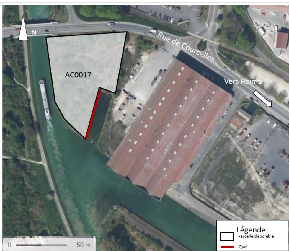
Parcelle n°4 – Port Colbert