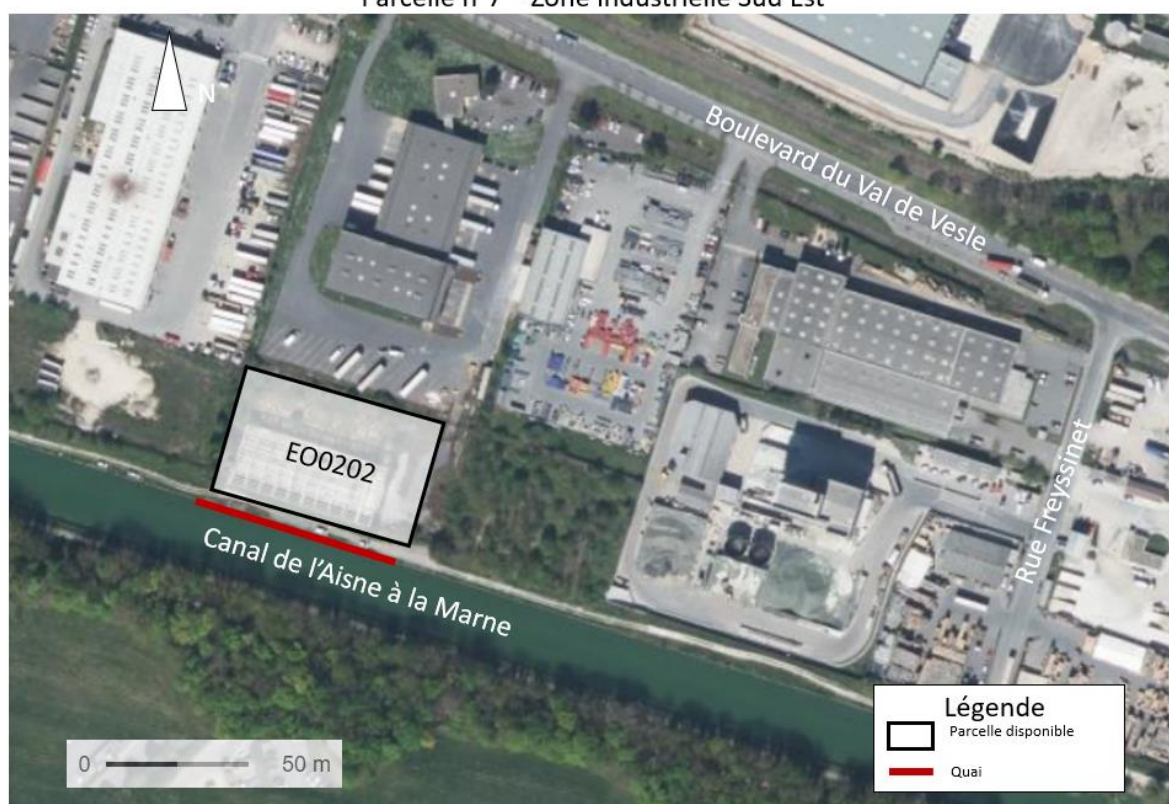
Parcelle n°7 – Zone industrielle Sud Est