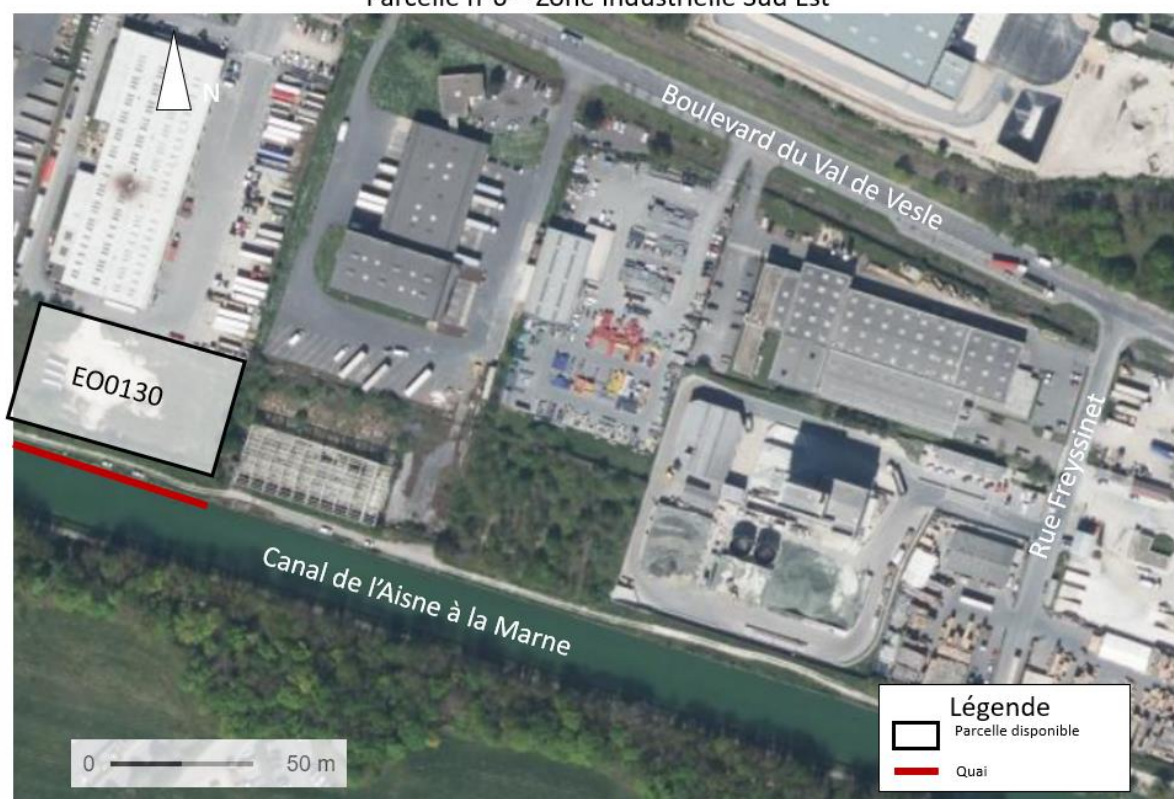
Parcelle n°6 – Zone industrielle Sud Est