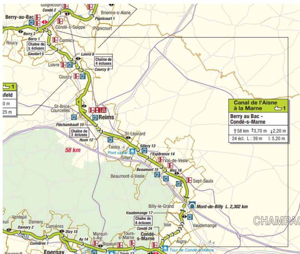
Le canal de l'Aisne à la Marne (carte VNF)