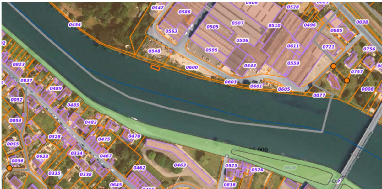
Emplacement de l'appel à projet