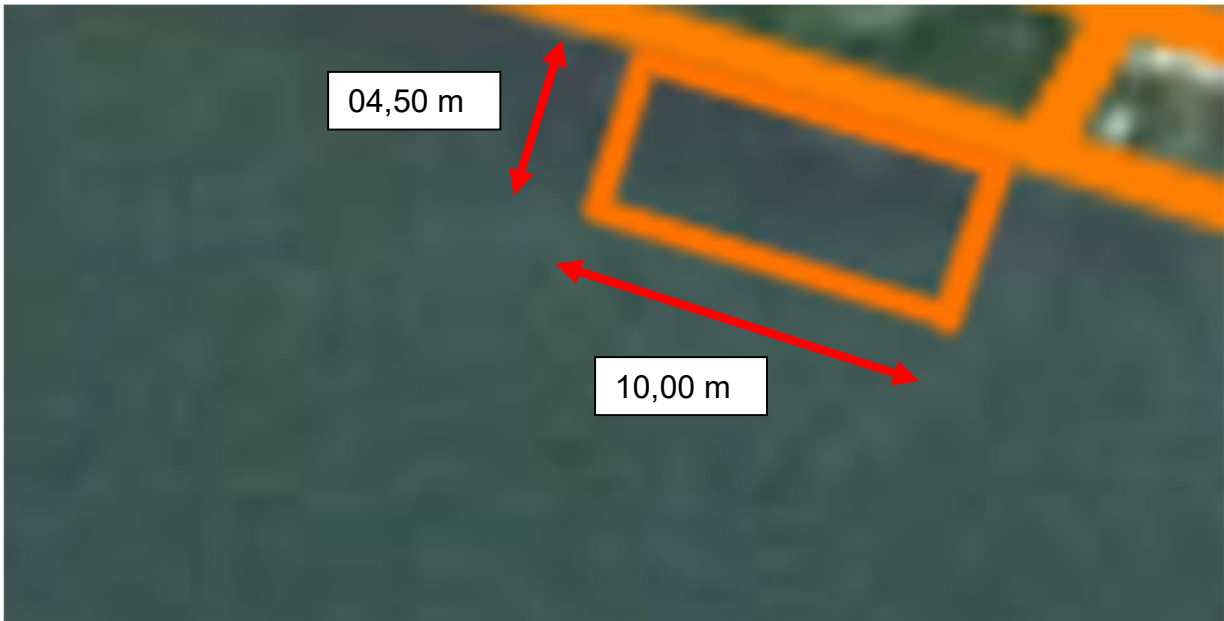
Dimensions de l'emplacement