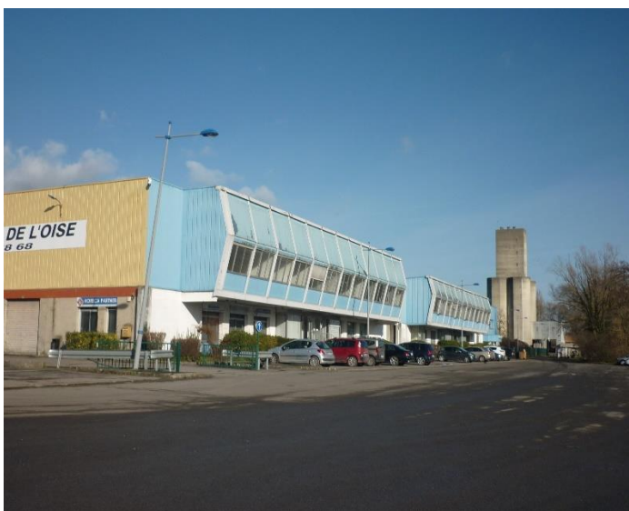
bâtiments et terre-plein (vue de l'aval du quai)