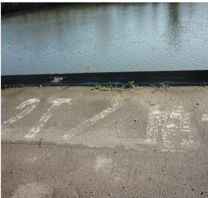
rail chasse-roue et peinture sur quai