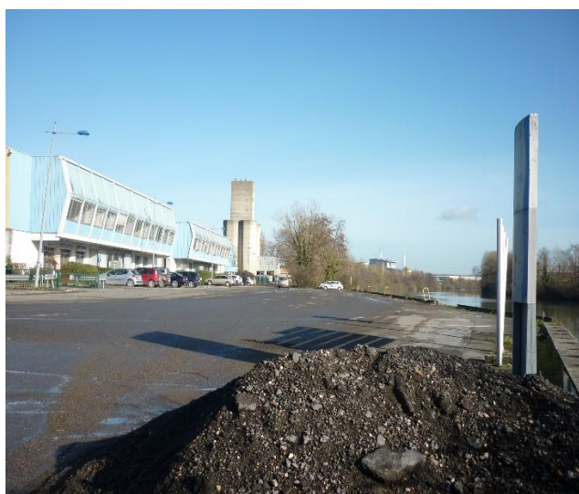
quai, terre-plein et bâtiment (vue depuis l'aval)