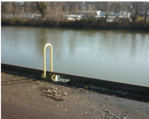
état sur quai

crosse d'échelle et rail chasse-roue en mauvais