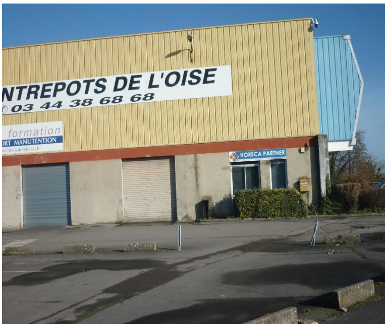
parking et bâtiment (vue de l'aval)