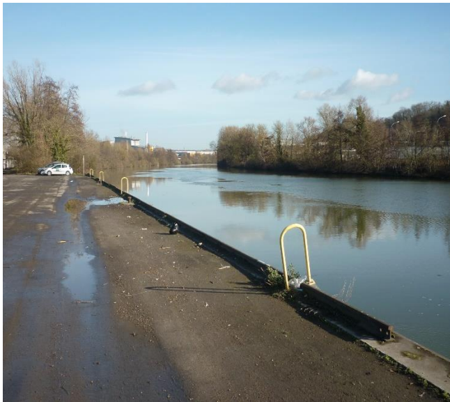
quai (vue depuis l'aval)