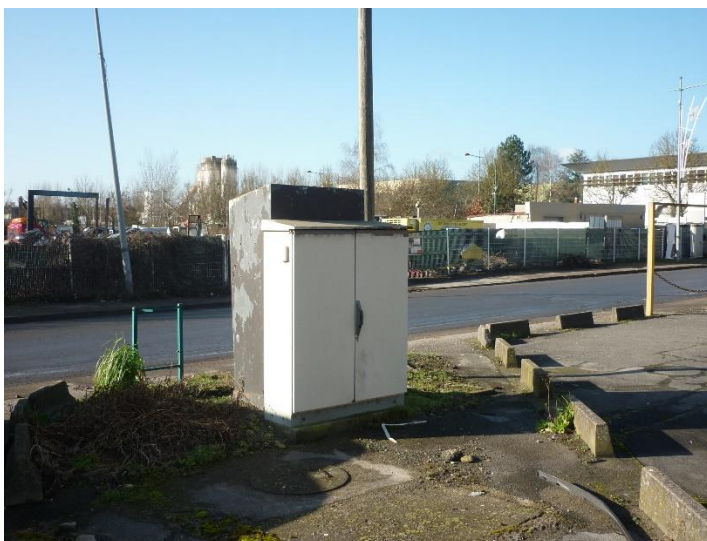
le long de la rue du Clos Barrois)