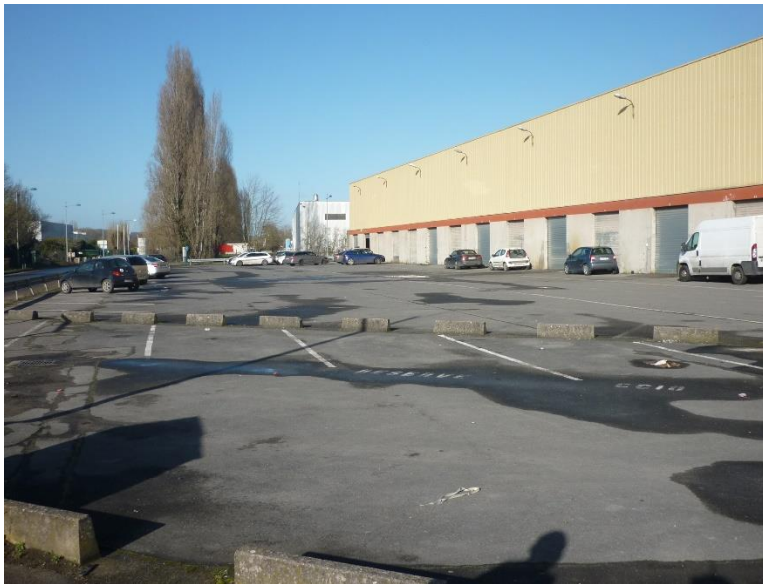
parking et bâtiment