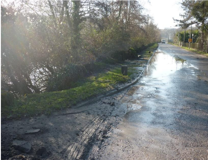
zone 1 – vue depuis l'aval du quai vers l'aval) bollard présent à l'aval du quai (hors