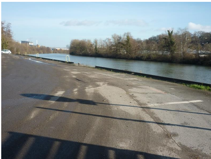
quai (vue de l'aval au niveau de l'angle de la rue du Clos Barrois)