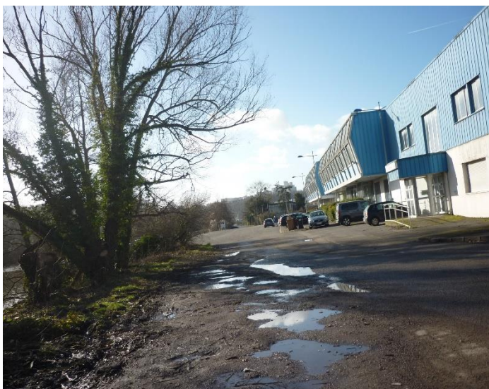
vue depuis la zone 2 AAP (amont zone 1)