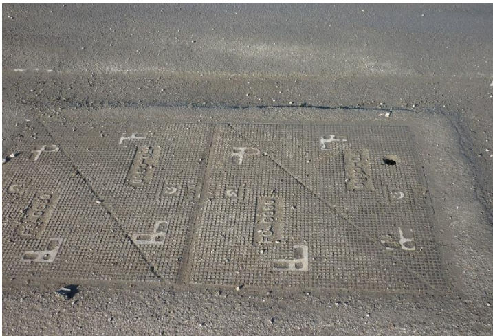
trappe de voirie présente sur le terre-plein du quai