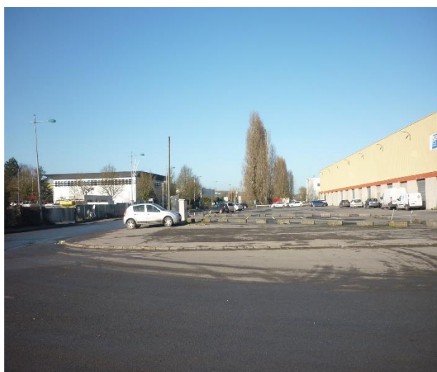
parking (vue depuis le quai) et accès par rue du