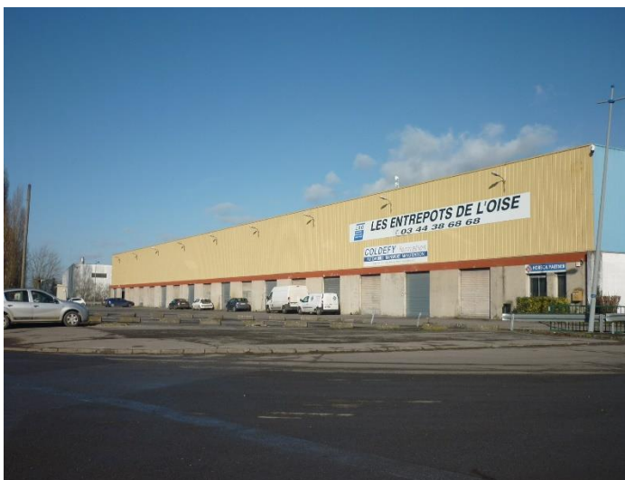
bâtiment et parking (vue de l'aval du quai)