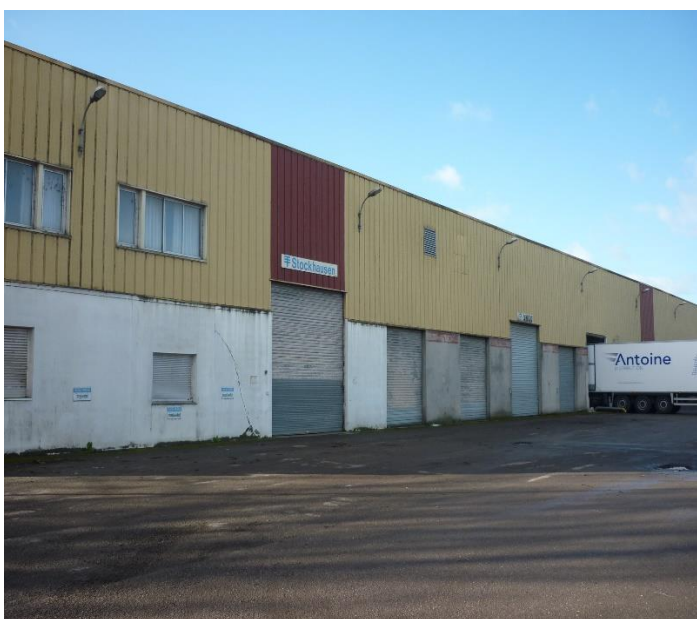
terre-plein zone 2 AAP) bâtiment (amont du site – vue depuis le