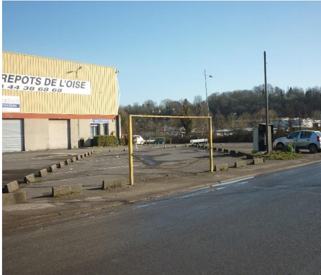
parking, bâtiment et armoire électrique (vue de la rue du Clos Barrois en direction du quai)