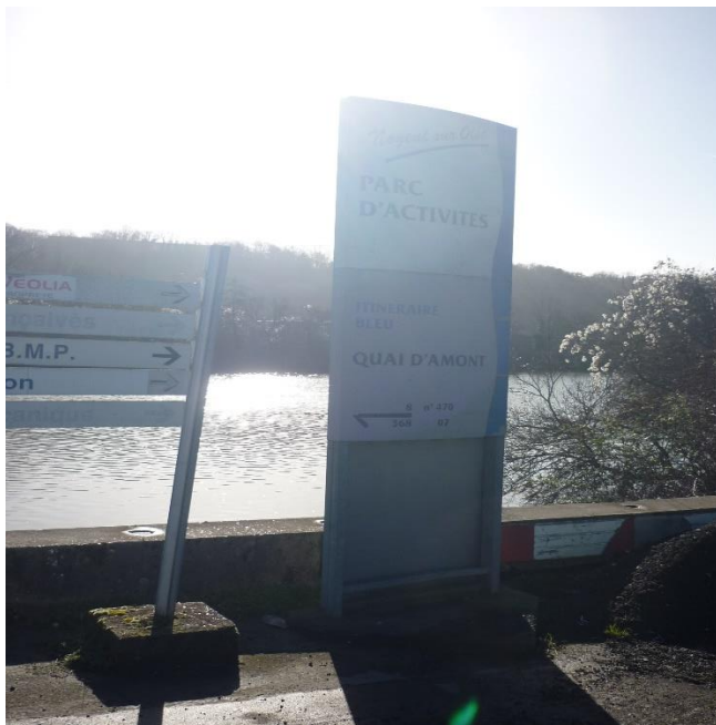
signalétique positionnée à l'aval du quai