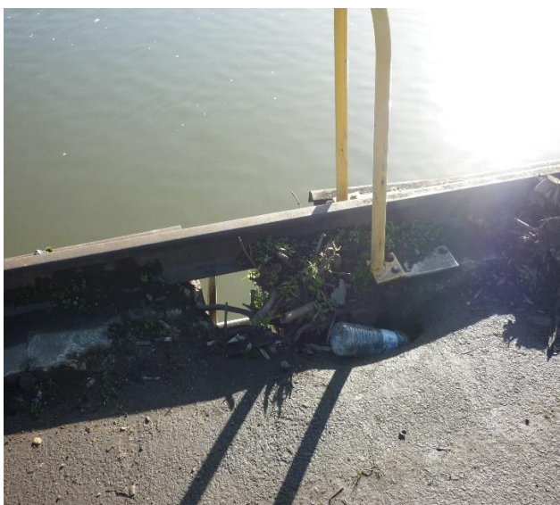
état sur quai

crosse d'échelle et rail chasse-roue en mauvais