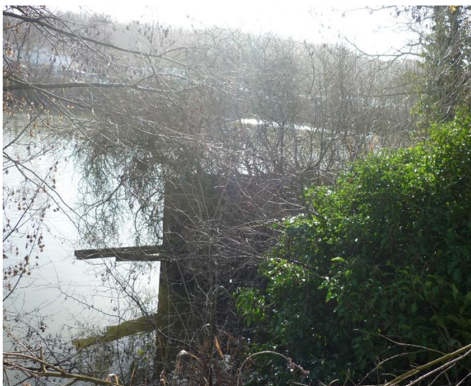
palplanches (amont du quai)