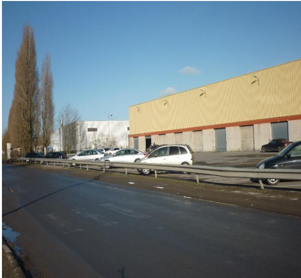
parking, glissière de sécurité et bâtiment (vue de la rue du Clos Barrois en direction de l'arrière du bâtiment)