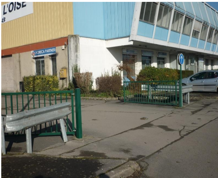
portail à l'entrée du parking et bâtiment (parallèle au quai)