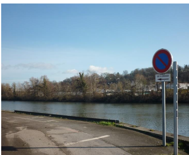
signalisation routière positionnée à l'aval du