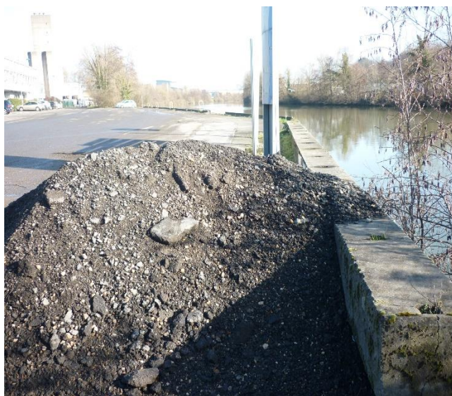
quai (vue depuis l'aval)